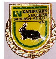
Ehrennadel des LV in Gold