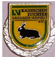
Ehrennadel des LV in Silber