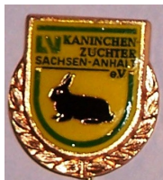
Ehrennadel des LV in Bronze