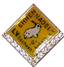
Ehrennadel für Vorstandstätigkeit in Silber