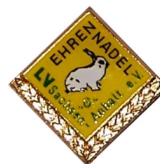
Ehrennadel für Vorstandstätigkeit in Gold