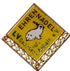
Ehrennadel für Vorstandstätigkeit in Bronze